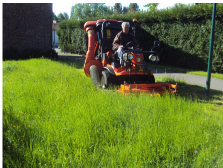
Emile ROSE Adjoint délégué aux espaces verts

Dès le lendemain matin, avec une météo favorable, elle est entrée en action pour rattrapper le temps perdu.