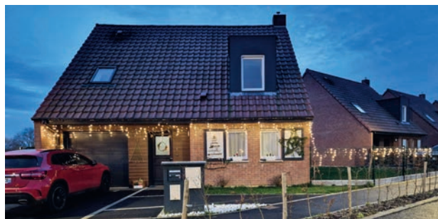
Lucie et Ludovic Dussart

au 34b rue de Fournes qui remporte le 1er prix !