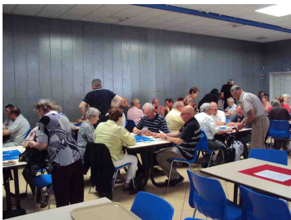
Concours du 20 mai 2014