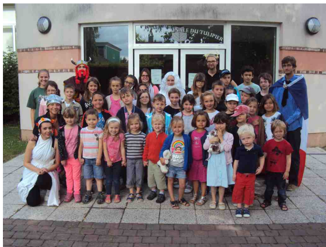
Centre aéré Juillet 2014